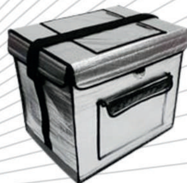
BioBox Plus / Plus M