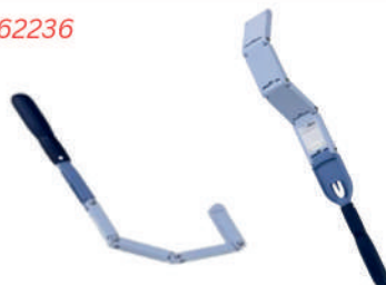
CE MultiSurface Cleaner™ 可濕熱滅菌多表面清潔器