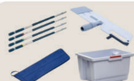
可滅菌清潔工作組