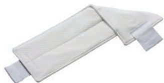
MicroIntensive™ L Mop 超細纖維拖把布(拋棄式)