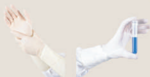
滅菌乳膠/丁腈手套