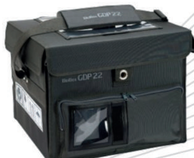
國際冷鏈運輸箱 BioBox GDP-G22/G39