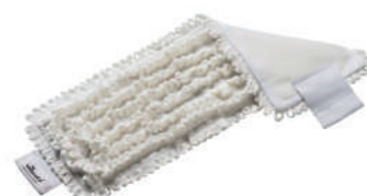
MicroStrong™ mop 超高速線圈拖把頭