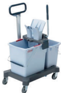
CE UltraSpeed Pro™ Double Bucket 無塵室雙桶推車組 (可滅菌)