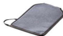
可重複滅菌手擦式清潔布套