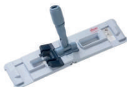
CE UltraSpeed Pro™ 拖把推板