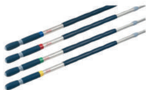
Extendable Universal Handle 伸縮拖把桿