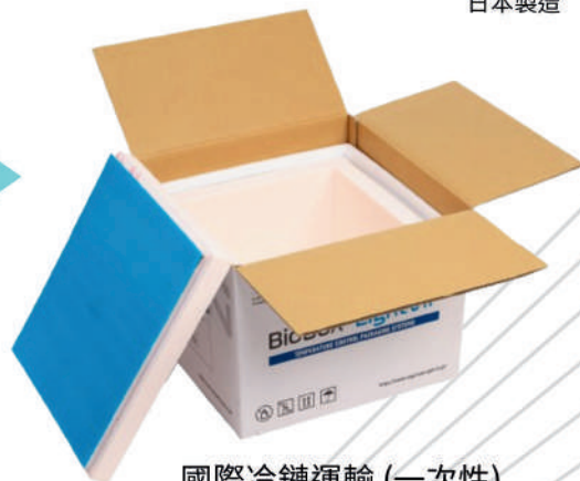
國際冷鏈運輸 (一次性) BioBox LIGHT VIP-27