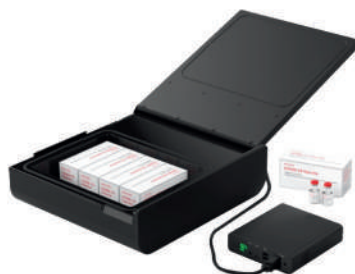
BOX TEXY-10V (5°C / 8hr)