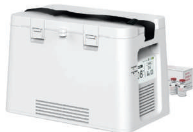
TEXY-ONE (0°C ~ 40°C / 12hr)