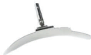
CE Tank Cleaner™ 潔淨室罐體清潔器