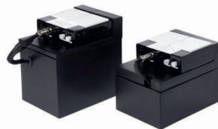
SBE-ELC / SBE-ELCT