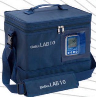
BioBox LAB-10 / LAB-20